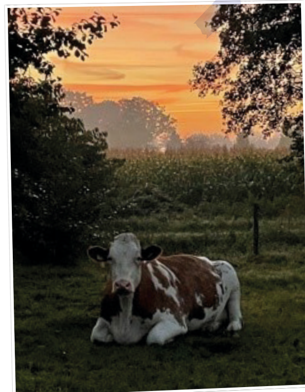
Den Ham nabij Mageler Es - Hans Broekhuizen ■

Mail die naar communicatie@twenterand.nl .