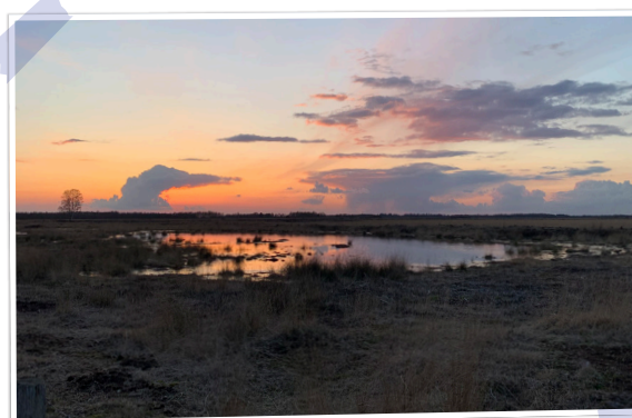
Avondlucht Engbertsdijkerven - H. Lammers.

Elke week een foto die gemaakt is in onze gemeente. Hebt u een mooie foto voor deze rubriek? Mail die naar communicatie@twenterand.nl .