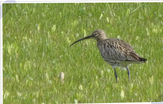
Prachtige Wulp aan de Kolenmieten in Vroomshoop ■

Elke week een foto die gemaakt is in onze gemeente. Hebt u een mooie foto voor deze rubriek? Mail die naar communicatie@twenterand.nl .